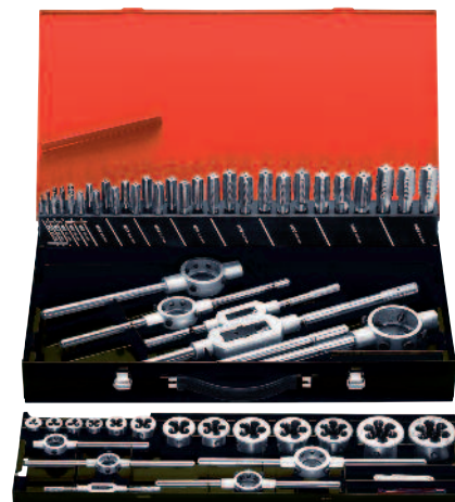
1795 0240 (fényes)